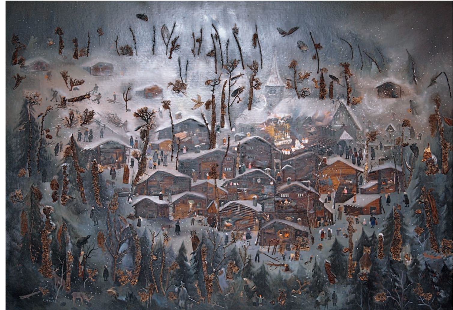
130 Personen beleben die wunderschöne Winterlandschaft von Bellwald. Das Bild stammt aus einer privaten Sammlung.

seinen Adlerhorst in Montorge. Man bezeichnet ihn als Walliser Brueghel, er erzählt in seinen Werken ganze Geschichten, seine Bilder sind pure Poesie. Er mischt mutig mit verschiedenen Materialien, fügt Federn, Moos und Birkenrinde in seine «Geschichten» ein. Diese sind mal verträumt, kindlich, fantastisch oder sarkastisch, zeitkritisch, herausfordernd. Er nimmt kein Blatt vor den Mund, wagt es, das Weltgeschehen und die Walliser Politik zu kritisieren. Die Religion spielt eine grosse Rolle in seinem Leben, er berührt und kommentiert jedoch alles mit sehr viel Humor und Witz. Sein Lachen widerspiegelt sich in seinen Augen, mit gehobenem Zeigefinger untermalt er seine Ausführungen. Lausbubenhaftes Lachen ertönt, wenn er erzählt, dass er ein Bild von Cézanne mit Aktfotos aus dem «Playboy» bereichert habe, der Arme habe das doch damals nicht zur Verfügung gehabt! Stillleben mit Roggenbrot und Trockenfleisch, die Zinnkanne mit dem Rotwein dazu werden zu seinem zweiten Markenzeichen. Doch man kann nicht von Menge sprechen, ohne seine Leidenschaft für die Frau zu erwähnen. Fasziniert von der Weiblichkeit, ist er der Schönheit verfallen, die Landschaften mit halbnackten Bäuerinnen bei der Weinernte in Savièse werden zu sinnlich erotischen Werken. Wieso sind die meisten gesichtslos? «Ein Ei hat auch kein Gesicht», ist seine bildhafte wie knappe Erklärung. Die Frau, das Weib als Ursprung des Lebens?