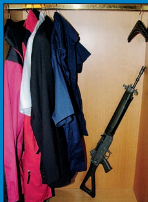
Armeewaffen zu Hause: Gefahr oder Notwendigkeit?