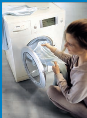
Klimaschutz: Wie jeder dazu beitragen kann